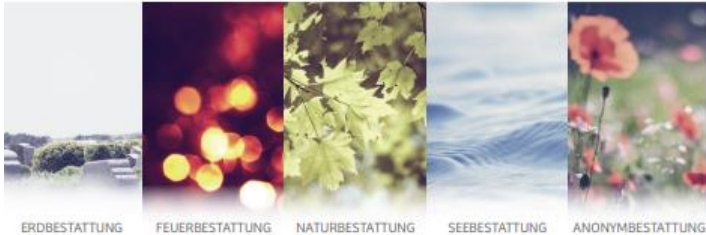
ERDBESTATTUNG FEUERBESTATTUNG NATURBESTATTUNG SEEBESTATTUNG ANONYMBESTATTUNG

So einzigartig wie der Mensch ist auch sein Abschied.