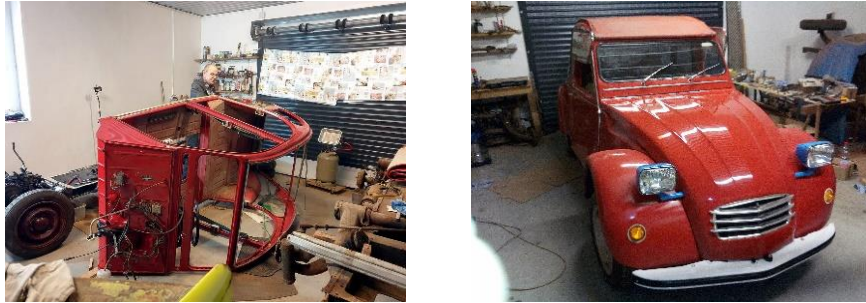
Bild 1: Arbeit am Fahrgastraum, bei der Ente „Häuschen“ genannt. Der Lack war in einem sehr guten Zustand und musste nur an wenigen Stellen ausgebessert werden Bild 2: Fertig und die TÜV Hürden überwunden. Die rote Ente bereit für die Zulassung.