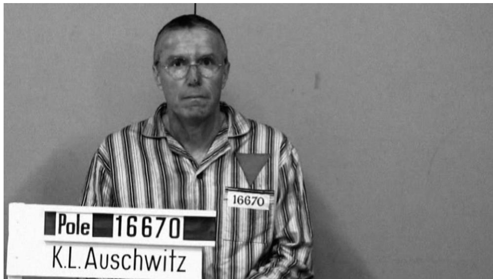
Maximilian Kolbe - ein Mann tritt aus der Reihe